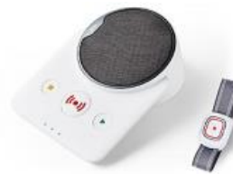
Abb.: Beispiel-Hausnotrufgerät „Novo“ inkl. Handsender „Smile“